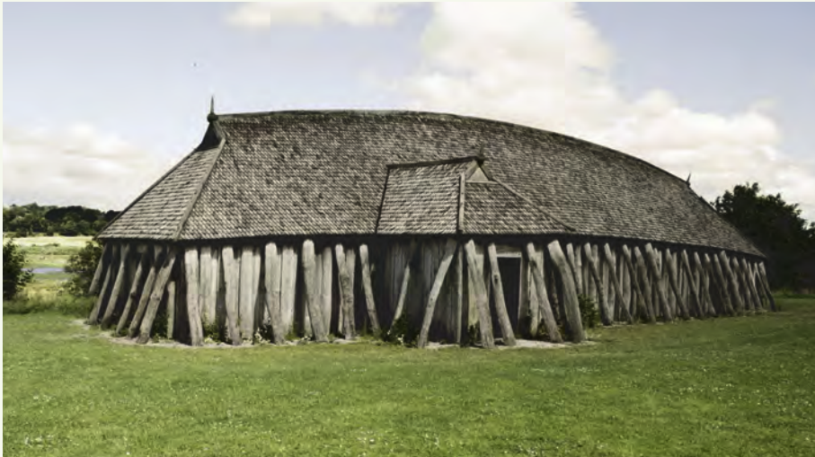
Langhäuser wie dieses waren über Jahrtausende die vorherrschende Wohnform in Nordeuropa.