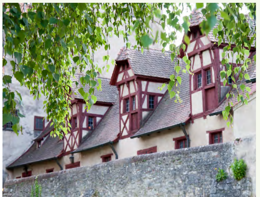
Arbeiten im Erdgeschoss – wohnen darüber: typisches städtisches Leben seit dem Mittelalter.

Ein Haus nur zum Wohnen? Im Mittelalter war den meisten Menschen dieses Konzept fremd. Man wohnte weiter in Langhäusern, die sich zu etwas stabileren und komfortableren Hallenhäusern weiterentwickelten. Langsam etablierten sich abgetrennte Räume für einzelne Bewohner. Unter diesen waren auf dem Lande meist auch Tiere – Menschen und Vieh schliefen Tür an Tür. Auch in den Städten kombinierte man Wohnen und Arbeiten. Heute würden Makler davon sprechen, dass eine „Home-Office-Maisonette-Lösung“ möglich sei. Früher hieß das praktisch: Der Schmied hat seine Werkstatt im Erdgeschoss seines schmalen Fachwerkhäuses – und seine Wohnung darüber.