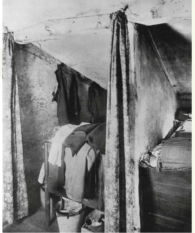
Betten wurden im Schichtbetrieb genutzt.

Erst mit der Industrialisierung trennte sich das Arbeiten vom Wohnen. Das städtische Bürgertum zog in die heute wieder so beliebten Altbauten mit Stuck an den Decken und Ornamenten an den prächtigen Fassaden. Die meisten Arbeiter lebten jedoch in den weitaus weniger prächtigen Hinterhäusern – sogenannten Mietskasernen. Dort lebte es sich nicht viel komfortabler als zur Steinzeit. Mitte des 19. Jahrhunderts wohnten häufig kinderreiche Familien in Wohnungen mit einer Küche, einem Zimmer und ohne eigenes Bad. Weil das Geld trotzdem knapp war, vermieteten viele ihre Betten zusätzlich an „Schlafgänger“ – junge alleinstehende Arbeiter, die in anderen Schichten als der Familienvater arbeiteten. Erst Anfang des 20. Jahrhunderts verbesserte sich die Situation – auch weil vielerorts Wohnungsgenossenschaften guten und bezahlbaren Wohnraum schufen.