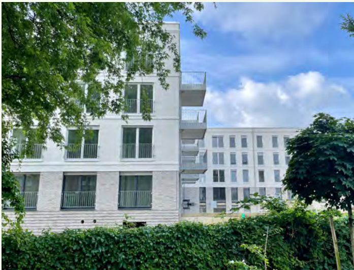
Seit 1960 hat sich die Wohnfläche pro Person in Deutschland mehr als verdoppelt.